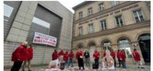
Le 5 mai, devant Bercy, ATTAC dénonce les multinationales biberronnées aux aides publiques (source ATTAC).

Dans le même temps, le gouvernement prévoit des « mesures de précaution » de 6 milliards d'euros pour l'année 2026. Ces milliards d'euros d'économies vont peser lourd sur les services publics et la fonction publique.